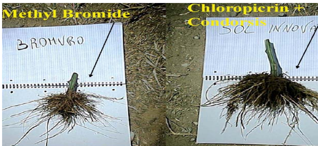
Εικόνα 7. Διαφορά ανάπτυξης ριζικού συστήματος με απολύμανση του εδάφους με βρωμιούχο μεθύλιο και με χρήση του λιπάσματος PERLKA.

Τα βήματα εφαρμογής της μεθόδου PERLKA είναι τα ακόλουθα: