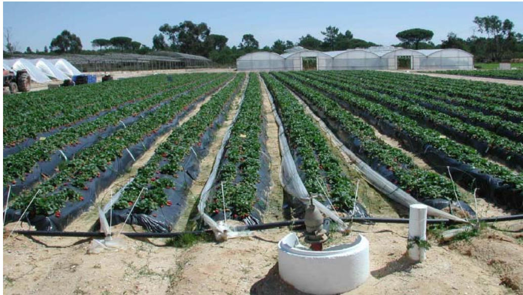
Εικόνα 5. Ηλιοαπολύμανση σε καλλιέργεια.