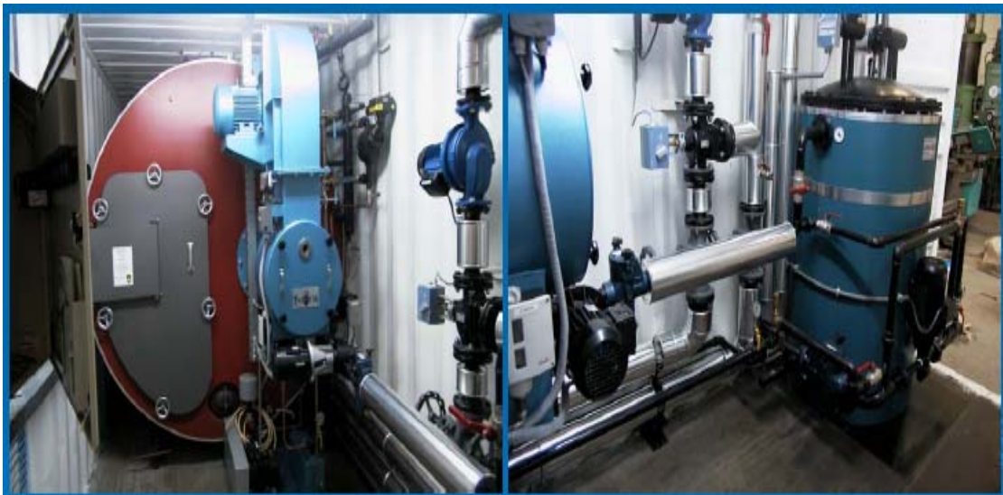
Εικόνα 3. Λέβητας για την παραγωγή ατμού.