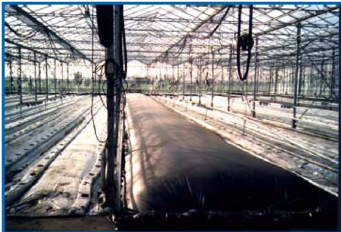
Εικόνα 4. Χρησιμοποίηση φύλλου πλαστικού στο εσωτερικό θερμοκηπίου και διοχέτευση θερμού αέρα για την απολύμανση του εδάφους.