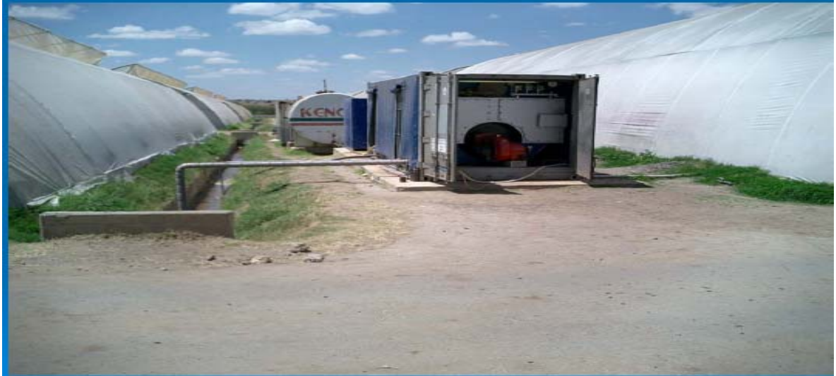
Εικόνα 2. Εγκατάσταση λέβητα δημιουργίας ατμού για την απολύμανση του εδάφους στο εσωτερικό θερμοκηπίου.