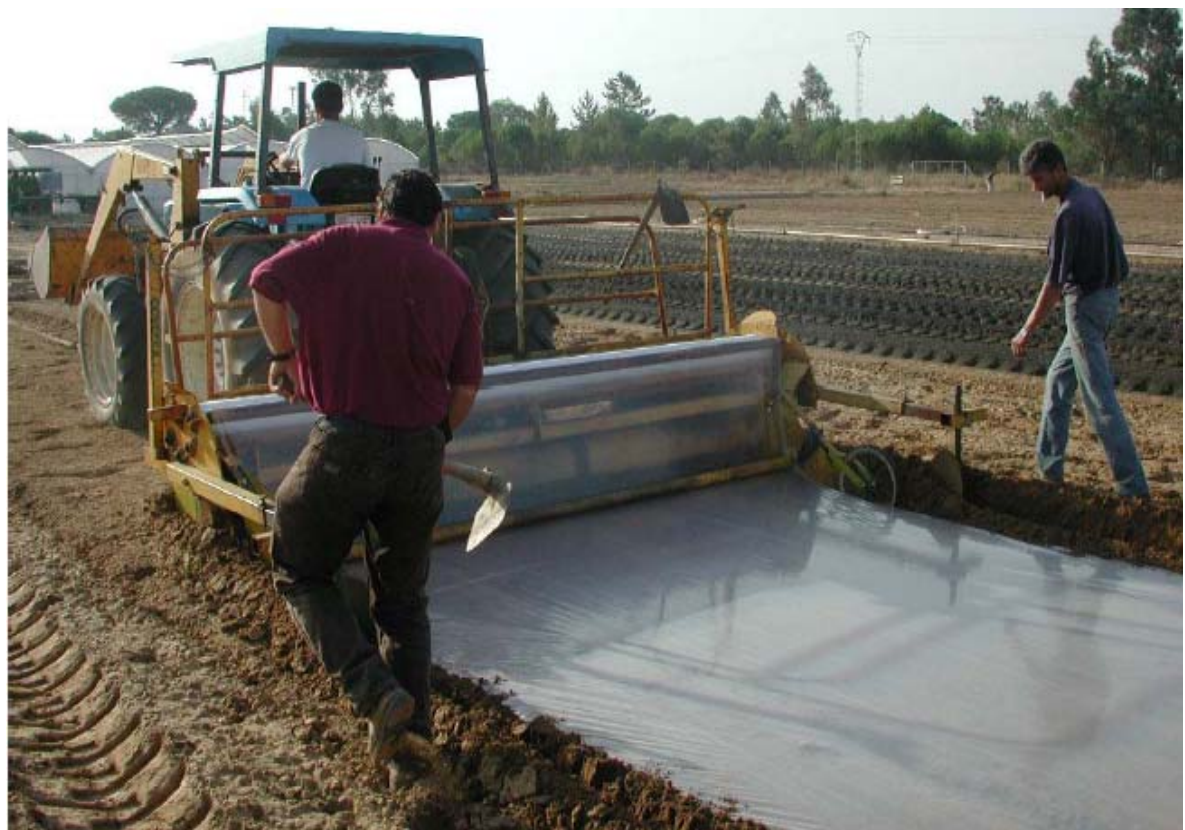
Εικόνα 6. Εφαρμογή της ηλιοαπολύμανσης. Τοποθέτηση φύλλου πλαστικού στο χωράφι.