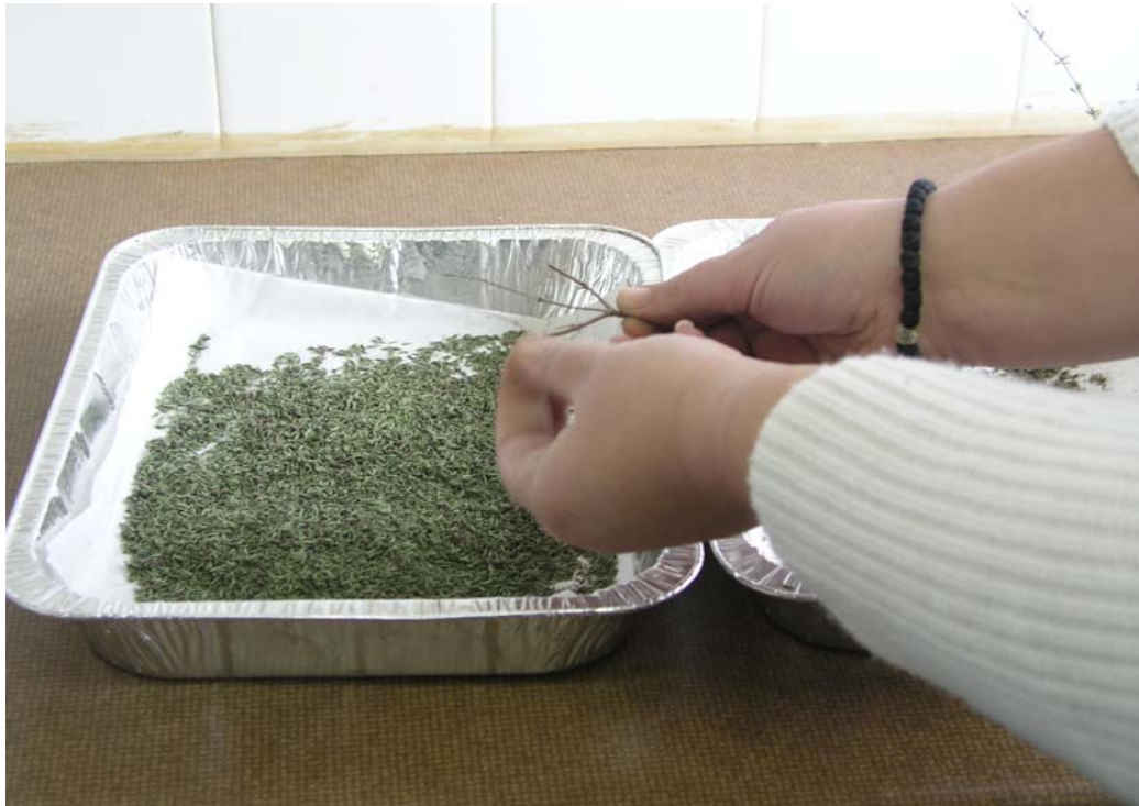
Εικόνα 3. Διαλογή φυτού θρύμπας με το χέρι, σε φύλλα, άνθη και στελέχη